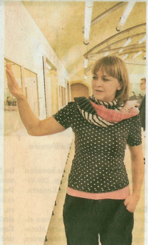
Fotografin Pepa Hristova war für die Vernissage extra nach Luxemburg gekommen